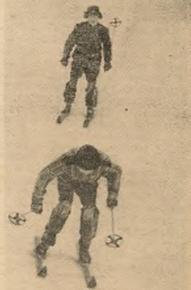
У НЯДЗЕЛЬНЫ ДЗЕНЬ.